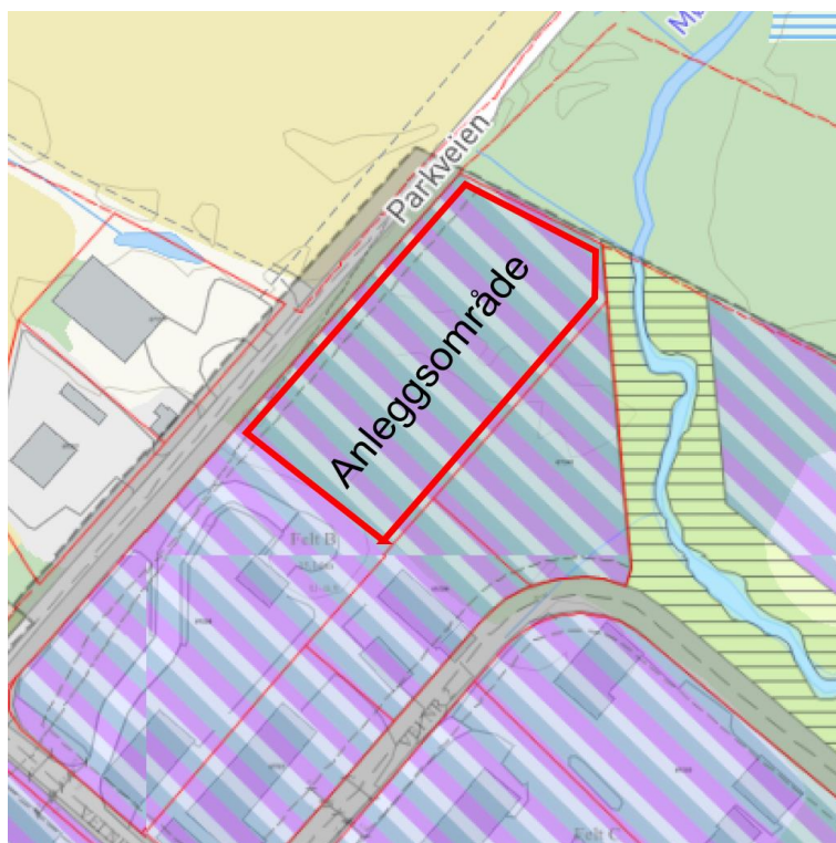
Utsnitt av vedtatt plankart.

Arbeidene skal utføres på regulert industriområde Reipå som vist i figur under: