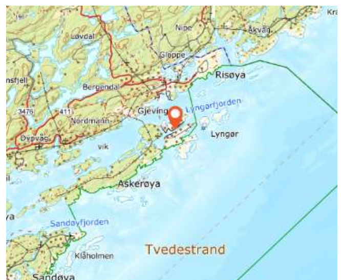
Figur 1: Oversiktskart over området

Adresse for stedet er Lyngørsida 56, 4910 Lyngør. Kaien ligger på eiendommen til Lyngørsida 56 etter avtale med grunneier og byggherre Tvedestrand kommune. Byggeår er oppgitt til 1982. ukjent.