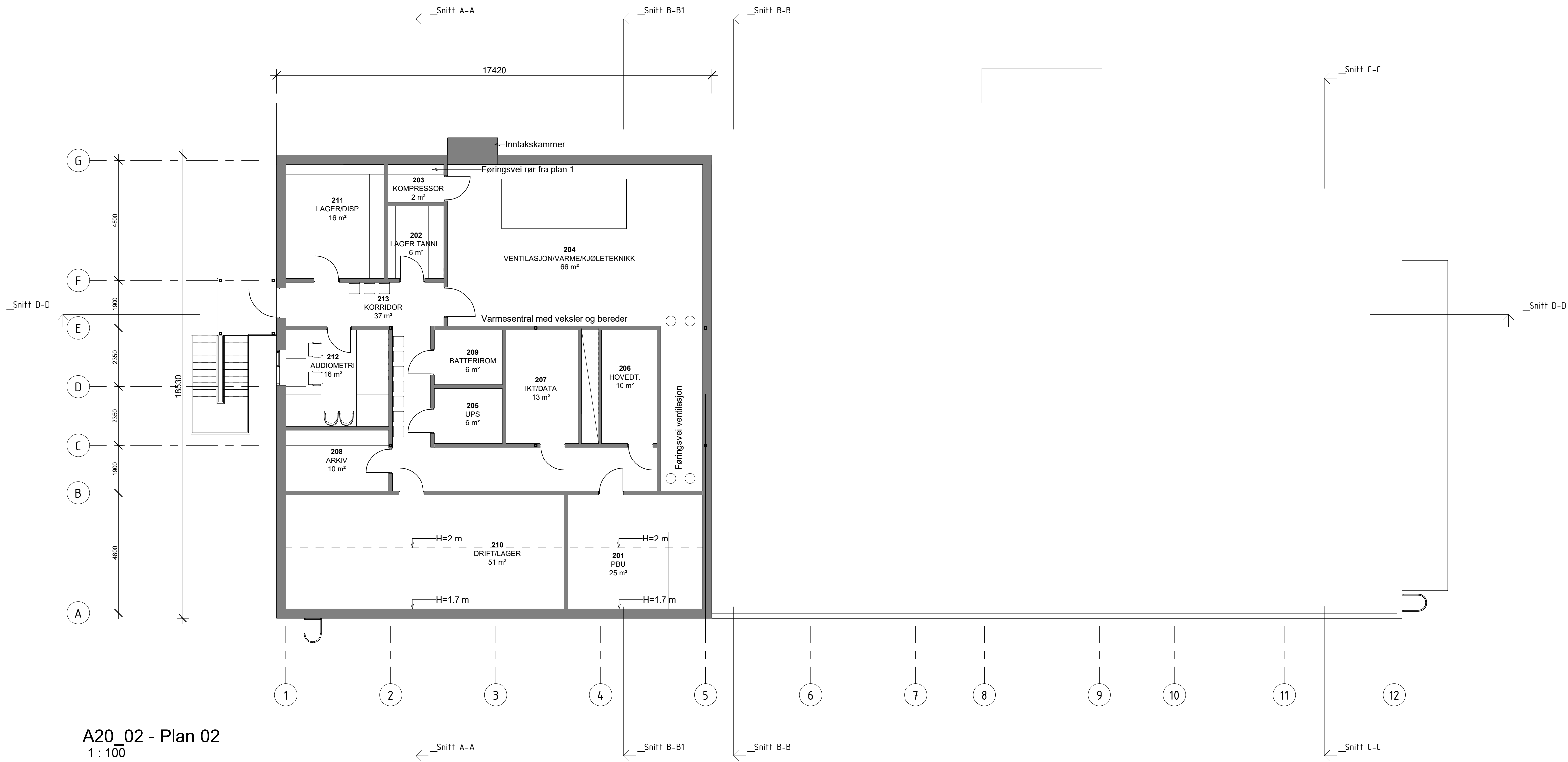
A20_02 - Plan 02 1 : 100