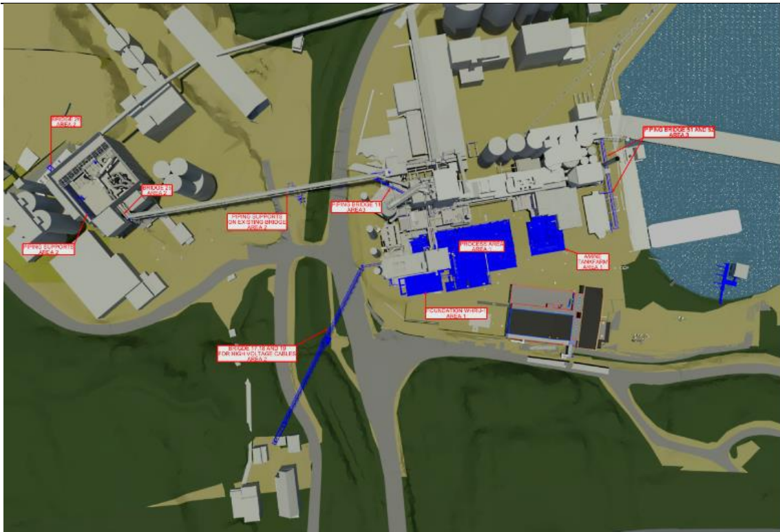
Figur 2: Civil work in the plant area