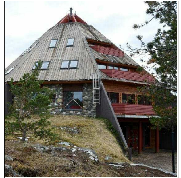
EKSISTERENDE SITUASJON SOM VISER TERRENGNIVÅ