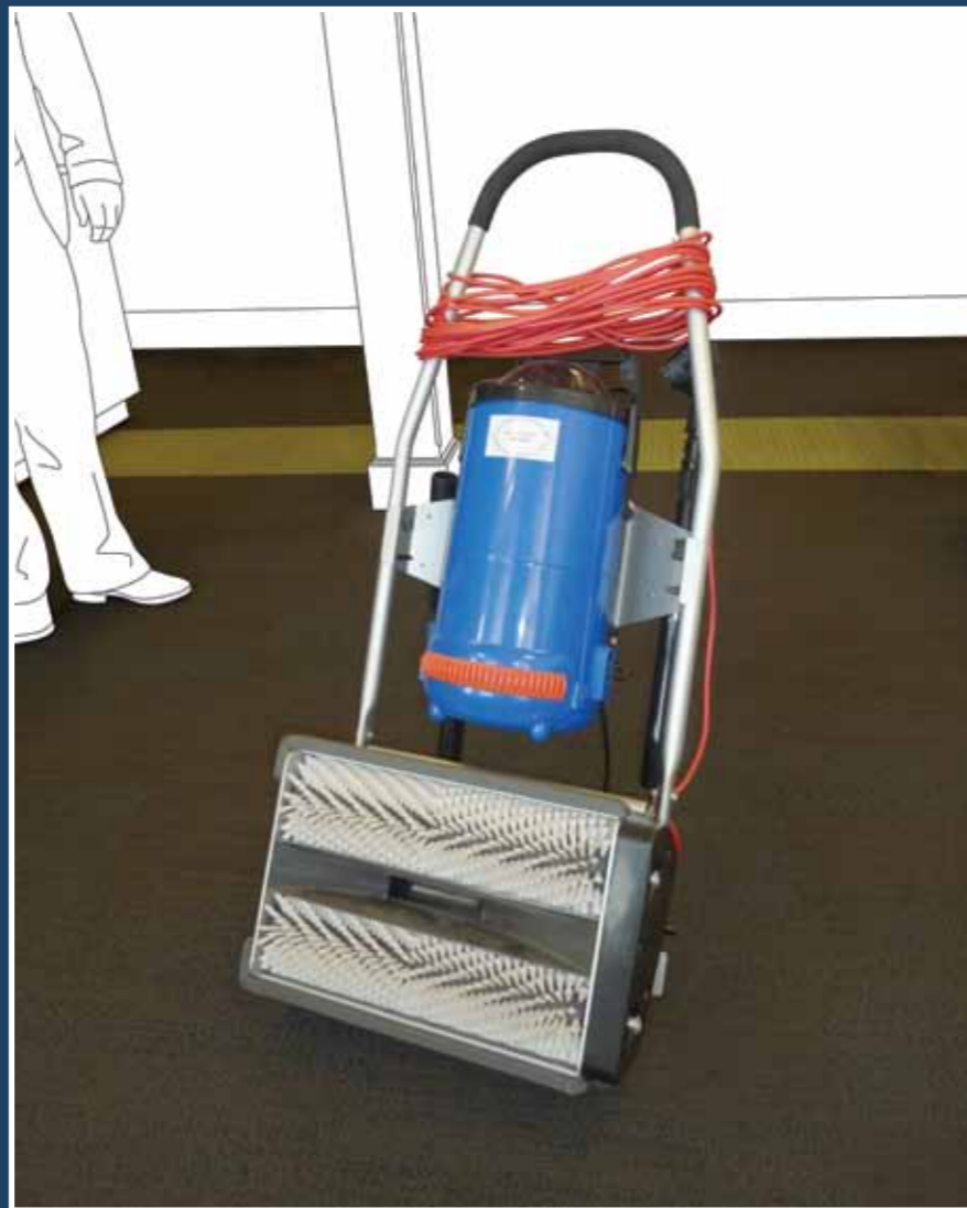
Maskin for løfting av luven

MERK: Denne prosessen bør ikke utføres på nålefiltprodukter, heller ikke på microtuft produkter.