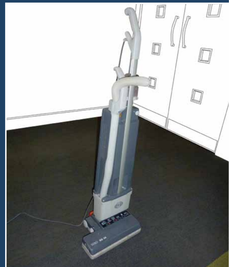
Eksempel – anbefalt støvsuger

Merk: For Superflor og andre nålefiltprodukter, bør det brukes en støvsuger med kun innsug.