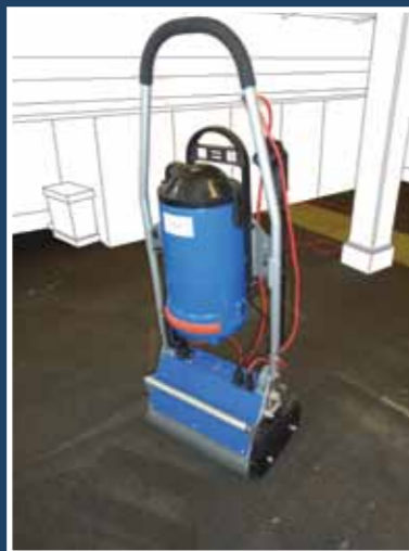
Tørrens (løfte luven)

Crystalline shampoo metoden bruker lite fuktighet og ligner en del på metoden for tørrens. Før du skal rengjøre med Crystalline shampoo bør du alltid støvsuge og løfte teppeluven. Så brukes en crystalline shampoo. Dette sprayes på med en elektrisk spraymaskin, en spray pumpe til hage stell, eller en trehoders roterende maskin. Teppeluven børstes lett, slik at rengjøringsmiddelet spres til alle fibre. La det tørke, rengjøringsmiddelet vil nå suge opp og feste seg ved møkk og lort. Tørke tiden vil variere